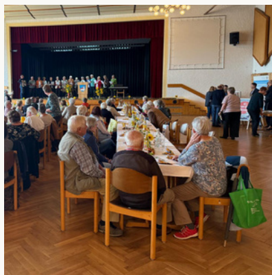
Besucher und Besucherinnen des Seniorenachmittags in Rotthalmünster