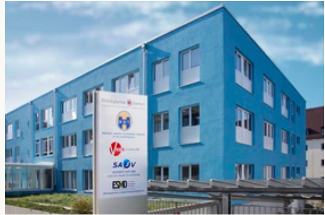
MVZ Dr. Vehling-Kaiser GmbH - Standort Landshut

Eine immer wichtigere. Demografie und Fachkräftemangel verstärken die Versorgungslücken – besonders in ländlichen Regionen. Gut geschulte 24-Stunden-Betreuungskräfte, die eng mit SAPV-Teams kooperieren, ermöglichen kontinuierliche Begleitung. Das ist menschlich und ökonomisch sinnvoll – und entspricht dem Wunsch vieler Menschen, zu Hause zu bleiben.