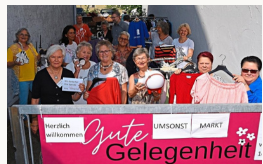
Das ehrenamtliche Team vom Gute Gelegenheit e. V.

Das Konzept ist einfach: Gut erhaltene Gegenstände bekommen eine zweite Chance und finden neue Besitzer. Gleichzeitig ist der Laden zu einem kleinen Treffpunkt für Menschen aus der Region geworden, die Nachhaltigkeit schätzen und Freude am Stöbern haben.